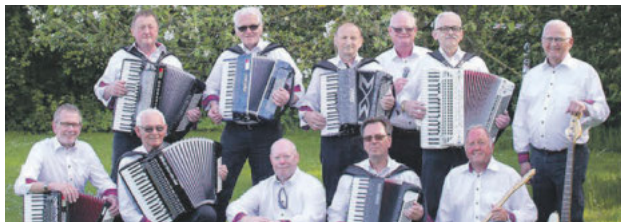
"Det Grå Guld" fra Sydthy.

Indbydelse til offentligt arrangement Oplev slagere sunget af